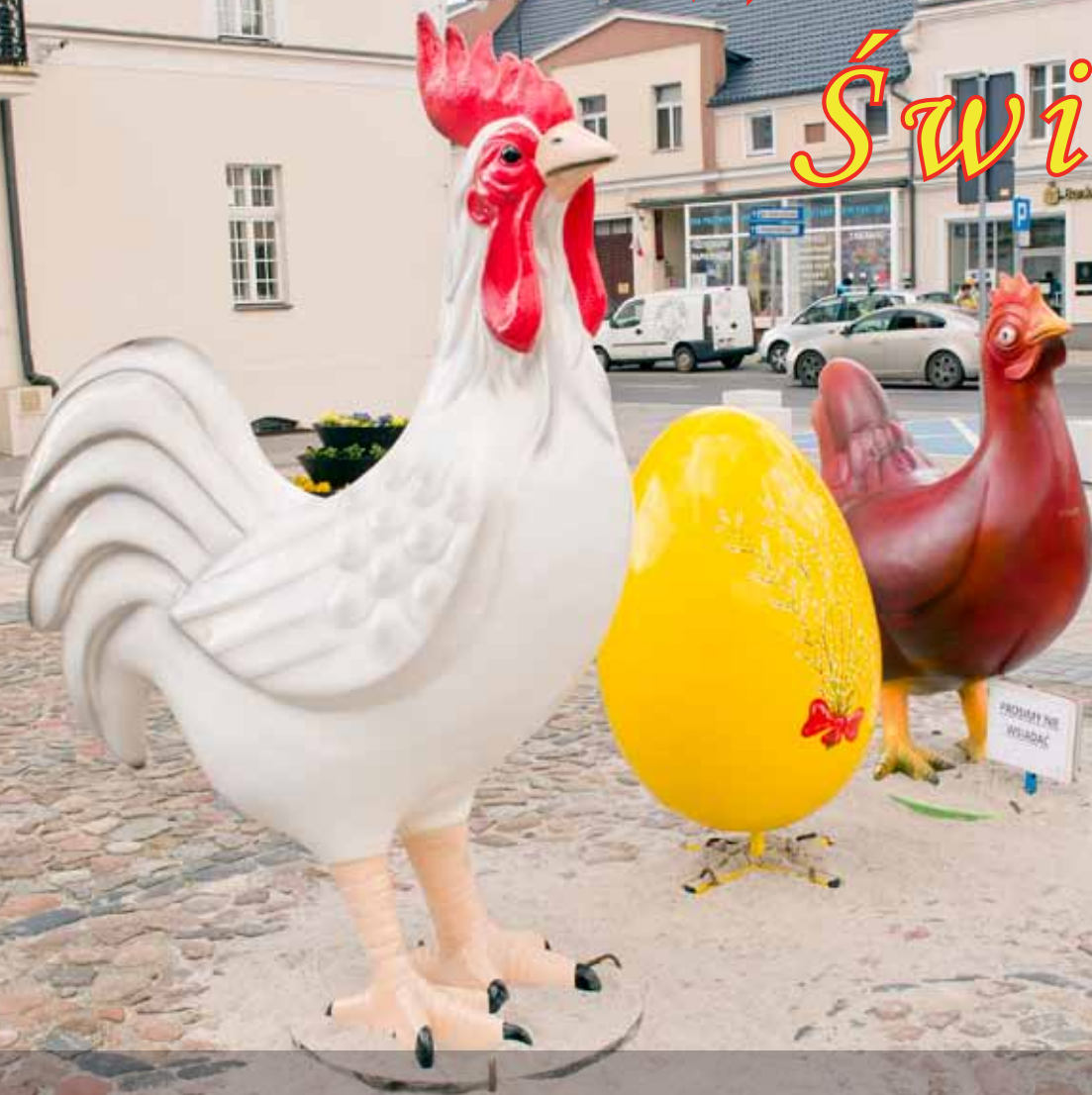
ozdoby na placu Niepodległości