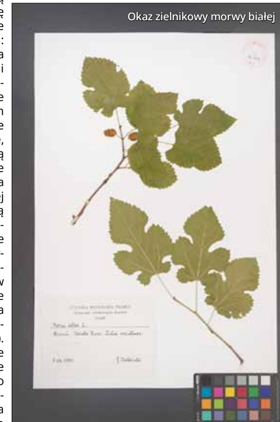
Okaz zielnikowy morwy białej

Morwa była wykorzystywana od wieków w tradycyjnej medycynie chińskiej. W XX wieku wzbudziła także zainteresowanie zachodniej farmacji i zoiolecznictwa. Liczne badania wykazały, iż roślina ta zawiera wiele związków chemicznych, które mogą być potencjalnie szeroko stosowane