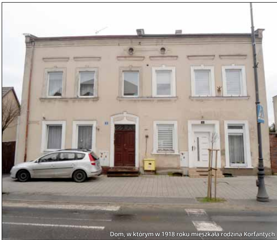
Dom, w którym w 1918 roku mieszkała rodzina Korfantych

Rodzina Korfantego opuściła Bnin w sierpniu 1918 i udała się do Charlottenburga, skąd udawał się na posiedzenia Reichstagu.